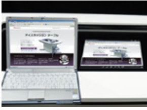
パソコン画面（Wi-Fi接続）

静止画・動画・アプリケーションファイルの読み込み表示に加え、様々なデジタル端末と接続利用することで、紙資料・パソコン等、フォーマットの異なるさまざまな情報（コンテンツ）を、必要な時に瞬時にテーブル上に表示することができます。