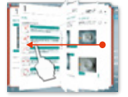
ページフリップ表示