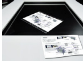
紙資料（スキャナーUSB接続）