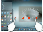
拡大・縮小・ズーム

コンテンツはカード化され、テーブルの上に表示されます。タッチパネルを使った簡単操作で、カードの移動・回転・拡大・縮小・書込み等を行うことができます。