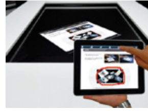
タブレット端末との静止画送受信（Wi-Fi接続）